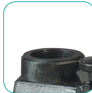
Sortie en 1"1/2 In / out 1"1/2 Salida en 1"1/2