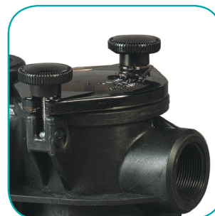
Couvercle de préfiltre transparent, avec papillons See through strainer cover Tapa de prefiltro transparente con válvula de mariposa